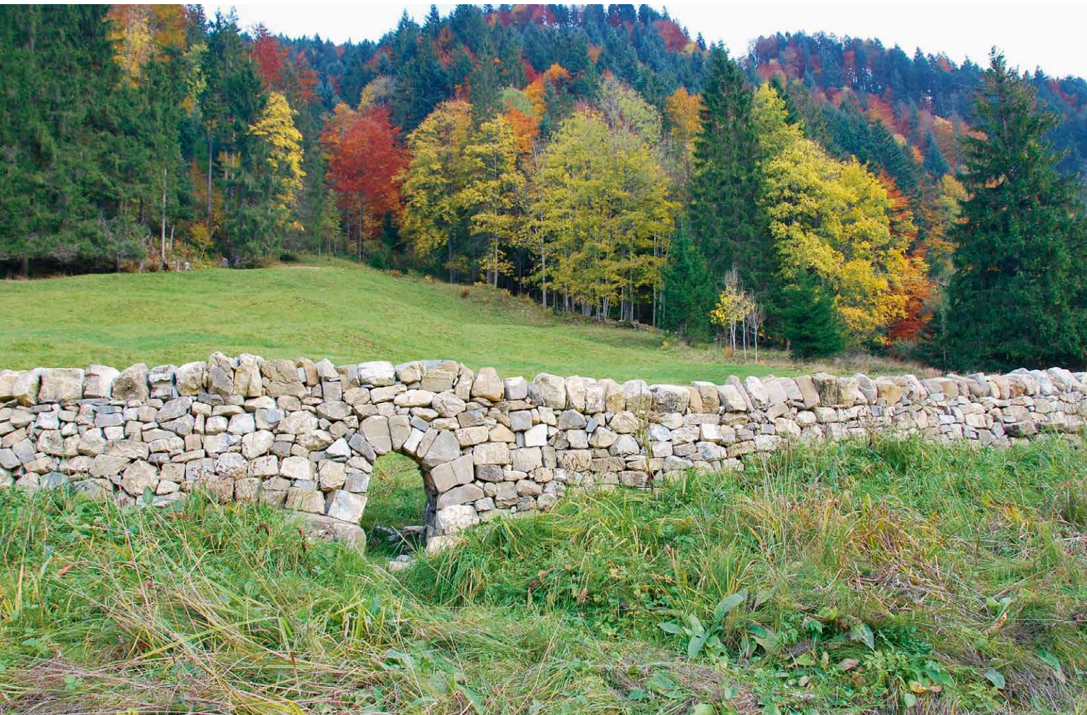
Trockensteinmauer im Alpthal SZ