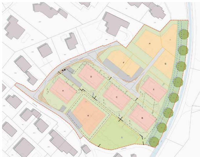
Überbauungsplan Sonnmatt, Walenstadt SG

Am östlichen Siedlungsrand am Hang liegt das Gebiet Sonnmatt, welches vom Kulturland lediglich durch den Widenbach getrennt ist. Im Auftrag der Grundeigentümer erstellte die suisseplan Ingenieure AG den Überbauungsplan, welcher eine ortsbauulich verträgliche Bauweise mit verschiedenen Gebäudetypologien und einer attraktiven Freiraumgestaltung sichert. Im Überbauungsplan werden ausserdem der Hochwasserschutz, die Freihaltung des Gewässerraums und eine zweckmässige Erschliessung geregelt. Der gegenüber dem Kulturland durchlässige Siedlungsrand wird durch eine abwechslungsreiche Bepflanzung entlang des Widenbachs aufgewertet, und es entsteht ein attraktiver Quartier-Spielplatz als Begegnungsort.