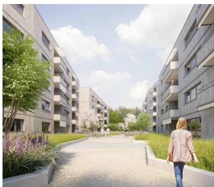
© lilin Architekten sia gmbh, Zürich