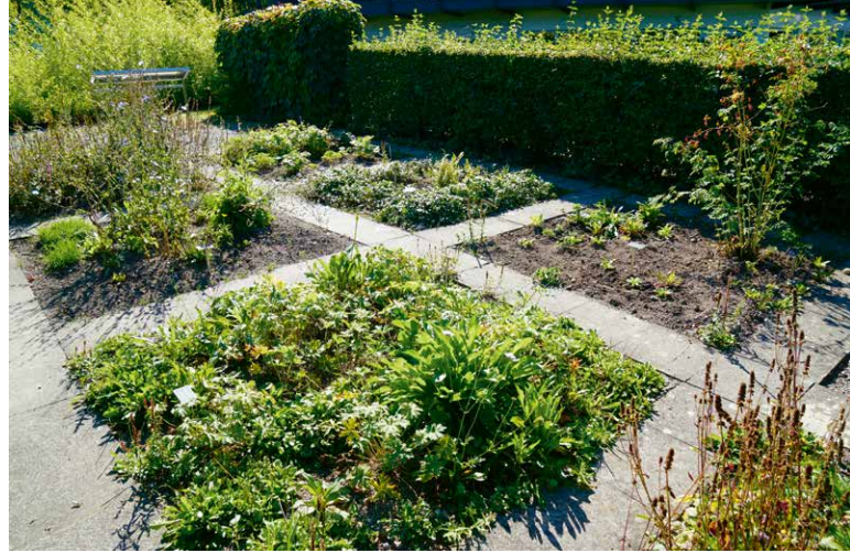
LEK Höfe, Schaugarten für die Bevölkerung, Pfäffikon SZ

Die konzeptionelle Landschaftsentwicklung basiert auf einem interdisziplinären und umfassenden Planungsgrundsatz. Das LEK zeigt konkrete Lösungen für die künftige Landschaftsnutzung auf und soll eine langfristige und breit abgestützte Entwicklung einleiten. Dazu werden Umsetzungsmassnahmen und konkrete Aufwertungsprojekte sowohl innerhalb des Siedlungsgebiets als auch in der unbebauten Landschaft angestossen. Als informelles Planungsinstrument baut ein LEK auf dem Grundsatz der Freiwilligkeit auf. Die Berichte, Massnahmenvorschläge und Pläne haben den Charakter einer Empfehlung. Im Rahmen eines LEK können anfallende Aufgaben einer Gemeinde koordinativ umgesetzt werden.