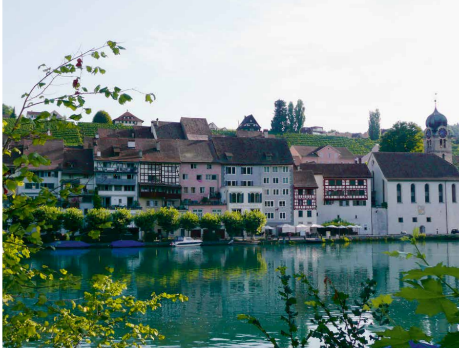
Eglisau ZH, Ortsbild von nationaler Bedeutung

Ein Sondernutzungsplan kann bereits im Zonenplan als Pflicht vorgeschrieben werden, oder er wird freiwillig erstellt, um den Grundstückswert zu steigern. Bestimmte Gebiete werden erst durch einen Sondernutzungsplan baureif. Fragen des Hochwasser- oder Lärmschutzes, der Erschliessung wie auch des Ortsbildschutzes sind zu klären. So können frühzeitig Nutzungskonflikte gelöst werden. Sorgfältige Planungen liefern ortsspezifische Lösungen für komplexe Sachverhalte.