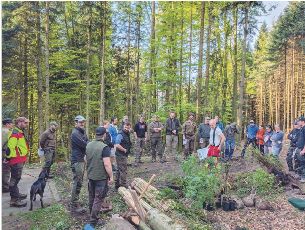
Am Samstag versammelten sich Jäger und Jungjäger im Wald im Chiemen, um 350 Pflanzen zu setzen.

Jäger bietet sich hier eine ideale Gelegenheit, ihre Pflanzenkenntnisse in der Praxis zu vertiefen. Mittelfristig ist geplant, die gesetzten Pflanzen zu beschriften, sobald sie ausreichend gewachsen sind. Dadurch entsteht ein anschauliches «Freiluft-Lehrbuch», das sowohl für die Ausbildung als auch für interessierte Besucher von grossem Wert sein wird.