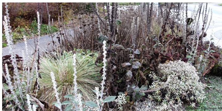
Schmuckvolle Samenstände im Winter