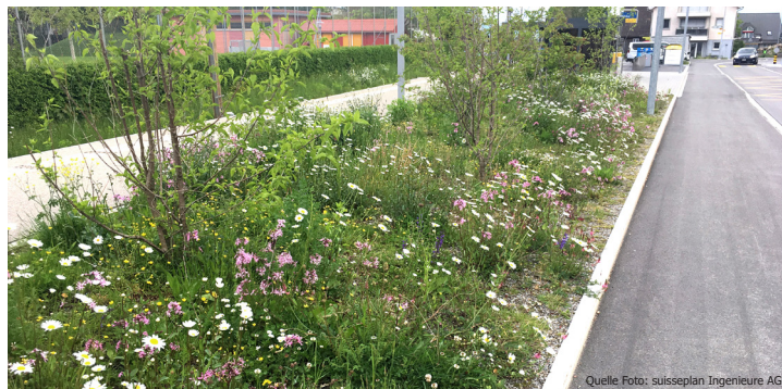
Verkehrsrandfläche als wertvoller und attraktiver Lebensraum