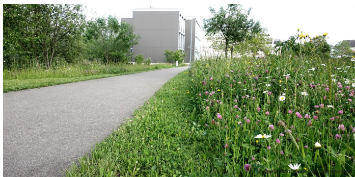
Rückschnitt im Bereich der Wege als gezielter Pflegeeingriff